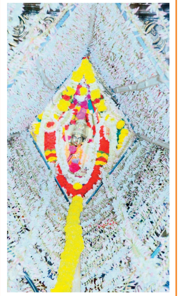
पिळगाव : तिसऱ्या श्रावणी शुक्रवारनिमित्त वरगाव येथील श्री चामुंडेश्वर देवीची करण्यात आलेली १ लाख जायांची पूजा.

पंचायत निवडणूक यंदा पक्षीय ठिकाणी भाजप पुरस्कृत उमेदवारांना पातळीवर झाली नसली तरी अनेक पराभवाचा धक्का बसला आहे.