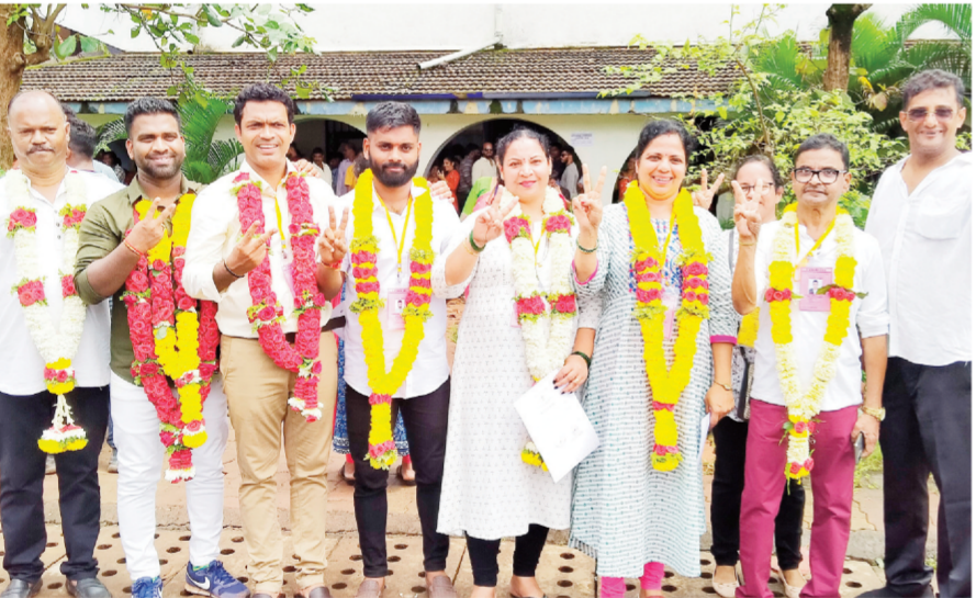
म्हापसा : हडफडे पंचायतीचे विजयी उमेदवार. (रमेश नाईक)